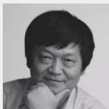
何人可 Mainland, China